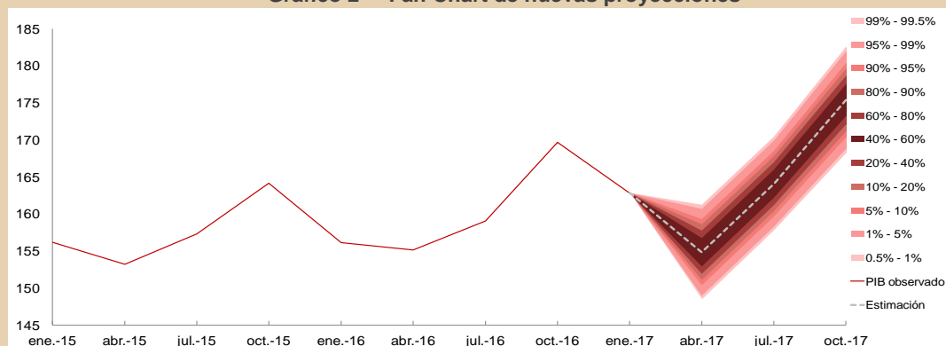
Gráfico 2 – Fan Chart de nuevas proyecciones